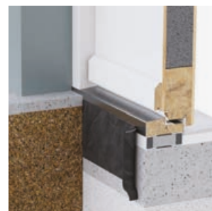
Sistem base (prag)