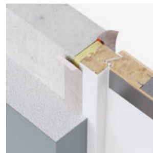
Sistem base (bară)