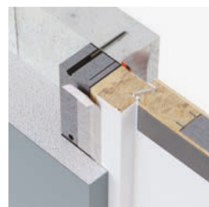
Sistem pasiv (bară)