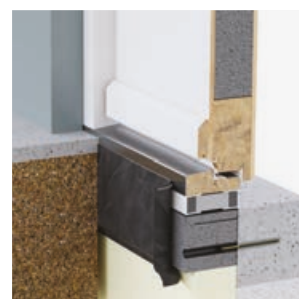
Sistem pasiv (prag)